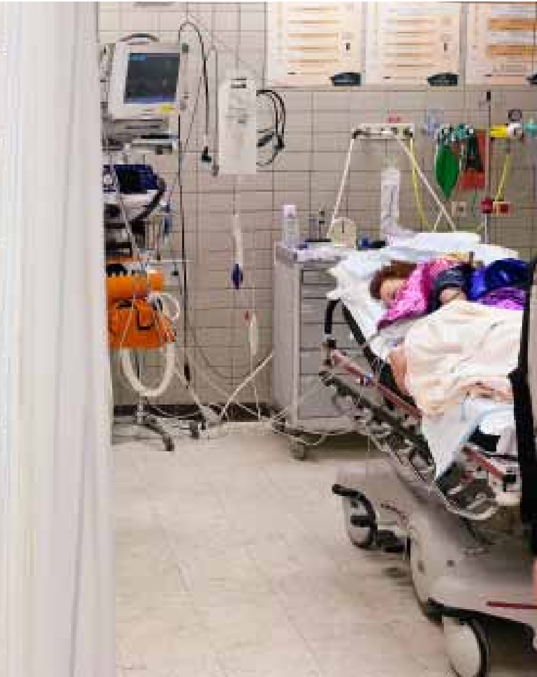
Erste hulp in 's-Hertogenbosch waar tijdens carnavalsnacht jongeren binnenkomen met een alcoholvergiftiging

zestien zijn om drank te kunnen kopen, maar bij welke kassa wordt de leeftijd gecontroleerd? En anders is er altijd wel een behulpzame vriend die wél zestien is. Met een Albert Heijn op praktisch iedere straathoek verwondert het dan ook niet dat één op de vijf pubers onder schooltijd drinkt. Drankreclame op tv mag sinds twee jaar niet meer vóór negen uur 's avonds, maar het aanbod direct na negenen is meteen na die maatregel verdriedubbeld en de industrie heeft haar weg ook gevonden naar de sociale media. Zo sloot Heineken onlangs een contract met Facebook.